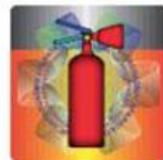
Slika 5. Izgled holograma u prirodnoj veličini