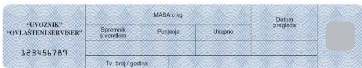
Slika 1. a